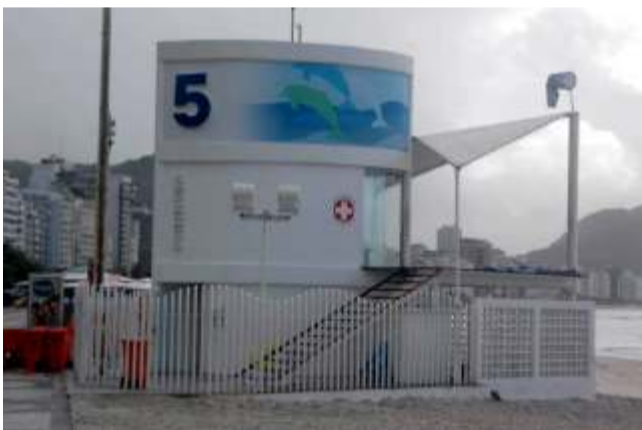
Guarita dos Salva Vidas no RJ tem inclusive uma sala de pronto atendimento na parte inferior.

Por que não podemos, aqui no sul, também oferecer guaritas melhores para estes trabalhadores que se dedicam a salvar vidas?