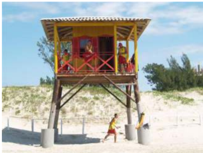
Guarita dos Salva Vidas em SC com abrigo e cercada.