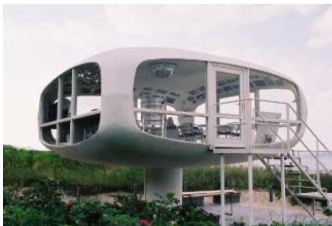
Guarita dos Salva Vidas na Alemanha