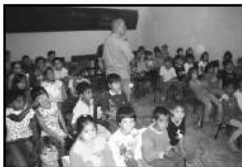
Na Escola Afonso Pedro a criançada adora!

A parceria formada entre a Secretaria de Educação e Cultura Mercedes Giroletti e a Equipe do O Maestro da Areia garantiu para todas as crianças das Escolas Municipais da praia a exibição do nosso Filme. Foi extremamente gratificante para a Equipe poder ver o sorriso das crianças, os olhos brilhantes grudados na tela e os dedos apontando os lugares em evidente identificação com o meio. O filme foi uma grande festa nas Escolas.