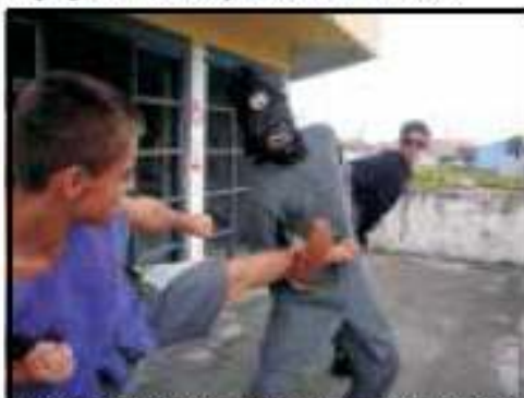
Cena de Ação do Filme A Lenda do Pé-Grande-Marisco! Imperdível! Breve num Cinema perto de você... se houver

Pediram uma Câmera emprestada para a mãe de um dos amigos veranistas e puseram mãos à obra! A Direção de Arte concebeu a figura aterrorizante do Pé Grande Marisco, idéias em profusão escreveram o intrincado roteiro e a guizada escolheu os temidos escombros da SAPS para locação. O resultado foi um empolgante filme de ação, aventura e mistério.