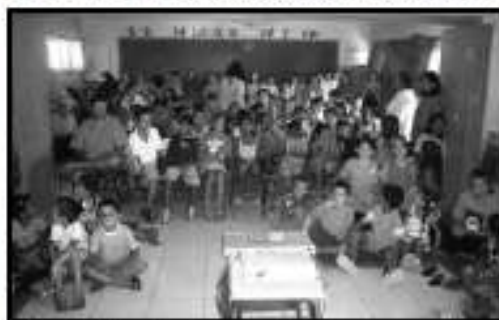
Na Escola Nilo Meneguetti, Sentado Louco!!!

A interatividade resultante da troca de sensações do filme com os olhos atentos dos estudantes foi uma experiência gratificante. Além das perguntas naturais sobre a feitura do filme, os alunos fizeram vários relatos e deram depoimentos de seus cotidianos referenciando as cenas do filme, construindo uma ponte entre a ficção e a realidade. Ver a sua praia, as suas dunas os seus colegas, amigos e vizinhos na tela do cinema, fez os alunos se aproximarem um pouco mais da arte do Cinema. Conhecendo a possibilidade e viabilidade de realizar arte e cultura com histórias e personagens da nossa Praia.