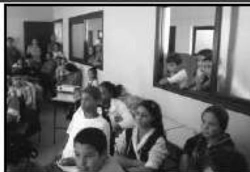
Na Escola Marcelino Dias a galera assiste o Filme até da janela!