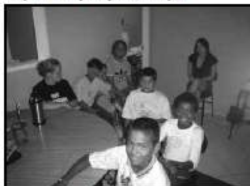
No L.A.U. um momento mágico de êxito.

Visualizar, conhecer e reconhecer o próprio cotidiano através da manifestação da arte em suporte áudio visual foi a proposta do Projeto Maestro da Areia na Escola, uma iniciativa da Secretaria de Educação e Cultura.