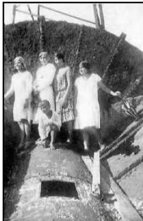
O Antigo Farol de Cidreira, era todo feito de ferro e tombou devido a ação da maresia. A ferrugem tomou conta da estrutura e acabou por derrubar o Velho Farol. na foto, Veranistas em cima dos escombros do Farol.

*Extraído do Livro Cidreira, História, Cotidiano, Cultura e Sentimento de Ivan Therra.