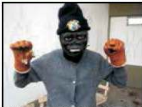
Foto tirada do Pé-Grande-Marisco. O Fotógrafo não sobreviveu!

Pediram uma Câmera emprestada para a mãe de um dos amigos veranistas e puseram mãos à obra! A Direção de Arte concebeu a figura aterrorizante do Pé Grande Marisco, idéias em profusão escreveram o intrincado roteiro e a guizada escolheu os temidos escombros da SAPS para locação. O resultado foi um empolgante filme de ação, aventura e mistério.