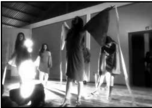
A Música "Santa de Luz" recebeu uma coreografia lindíssima, destacando-se no Festival.

A Secretaria Municipal de Educação e Cultura de Cidreira através do Projeto Festival de Danças de Cidreira, criou um espaço de manifestação cultural e artística ímpar em nossa praia. Crianças e Jovens de Cidreira focados em se manifestar através da arte, centrando seus esforços em coreografias e movimentos de expressiva plasticidade. Um momento mágico de cultura.