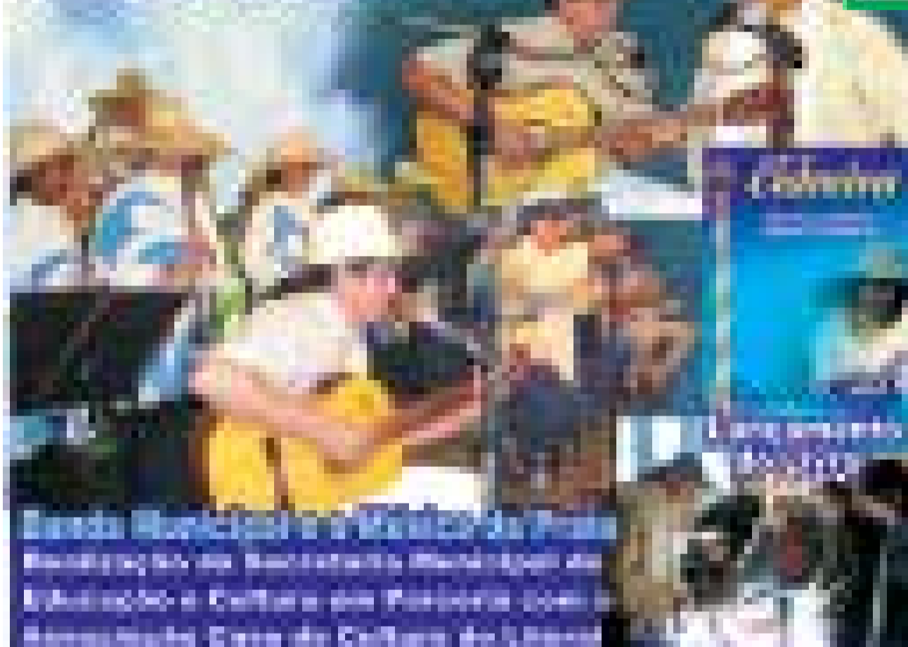
Foro de Cultura e Lançamento do Livro de Cidreira. A imagem mostra uma reunião de pessoas em torno de uma mesa com livros, durante um evento cultural.

o Fórum de Cultura e o Lançamento do Livro de Cidreira