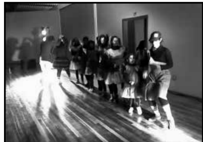
Um dos Destaques do Festival foi a Coreografia da Música "Barrigudinho", apresentada sob muitos aplausos.

A Secretaria Municipal de Educação e Cultura de Cidreira através do Projeto Festival de Danças de Cidreira, criou um espaço de manifestação cultural e artística ímpar em nossa praia. Crianças e Jovens de Cidreira focados em se manifestar através da arte, centrando seus esforços em coreografias e movimentos de expressiva plasticidade. Um momento mágico de cultura.