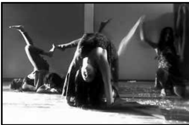
O festival apresentou danças e indumentárias de muita qualidade.