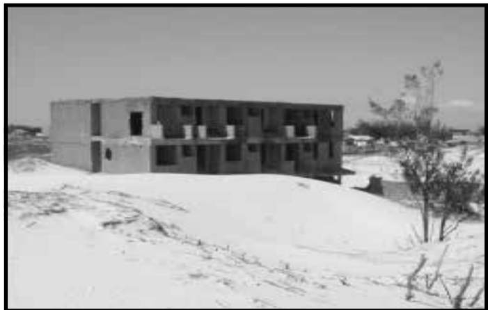
As Dunas não se desintegram, mudam de lugar.

Será que a nossa praia está pensando no que fazer em relação ao aquecimento global? Ou o nome "global" nos coloca fora da esfera de ações realmente eficazes para solucionar os problemas. Será que nos consideramos tão pequenos que não podemos sequer contribuir com ações, atitudes e idéias? Nós somos uma comunidade de muitas riquezas naturais: praias, dunas, lagoas, matas nativas e fauna e flora com rica e singular diversidade. O que está sendo feito em nível institucional para a preservação de nossa natureza?