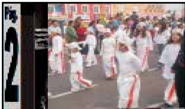
Juventude da praia reivindicou a Preservação das Dunas e Lagoas, Cidade Limpa e melhorias na Saúde.