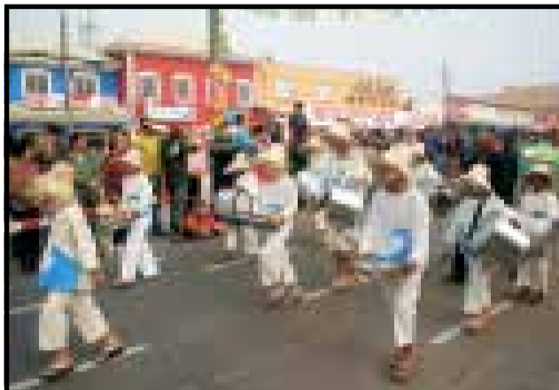
Destaque Especial para o Grupo de Percussão Praieira da Escola Alfredo Pedro, que apresentou o nosso Filme O Maestro da Areia e o Grupo Boizinho da Praia valorizando e divulgando a Cultura Popular de nossa praia.