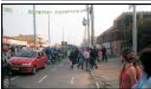
O Ponto Negativo ficou por conta do Lixo e Entulhos da Obra do Prefeito, ilegalmente depositados sobre a calçada, atrapalhando o Desfile e enfeando a cidade.