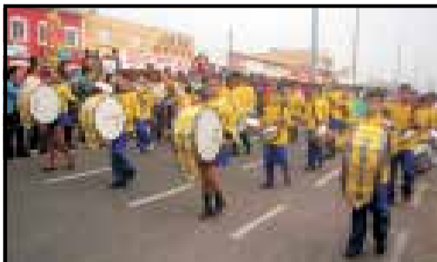
Banda das Escolas Herlita e Ildo foram muito aplaudidas.