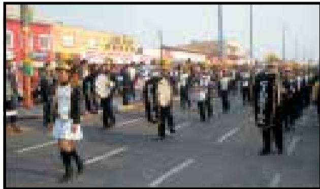
A nossa Banda Municipal deu show na Avenida.

O Desfile Cívico de Cidreira estava muito bonito com grande participação da comunidade. O dia lindo colaborou para iluminar o sorriso colorido de alegria das crianças e jovens de nossa praia.