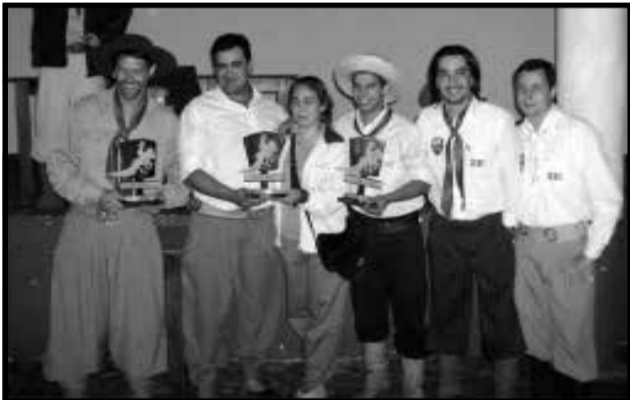
O Vencedor Trio Te Achica de Torres recebendo os

Levaram a Melhor: 1º Lugar: Trio de Achica de Torres, 2º Lugar: Trio RJR de Xangri-lá, 4º Lugar: Trio Floreio de Osório. O Torneio que trouxe pessoas de várias cidades no estado para a nossa praia, foi organizado e realizado pelo Grupo Marisco Pitoco, e mais uma vez sem qualquer apoio da Prefeitura que continua apenas fazendo Camarões.