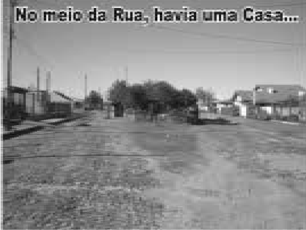
Esta antiga casa já faz parte da história de nossa praia.