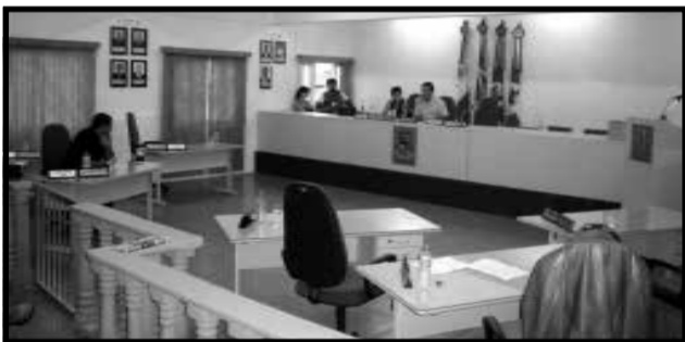
ATO II - Em seguida tentaram esvaziar a sessão...