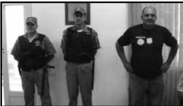
ATO III - Foi chamada a Brigada Militar e a Polícia Civil para acalmar os ânimos dos mais exaltados...