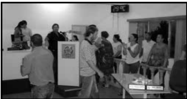
ATO I - Ao saber que não haveria eleição os vereadores da situação, indignados, promoveram um badernaço, xingação, gritado e bateção nas mesas.

Alguns vereadores da situação bradaram pela realização da eleição, pois segundo o Regimento Interno da Câmara de Vereadores, os mandatos são de apenas um (01) ano e as eleições devem ser realizadas até o dia 15 do mês de dezembro.