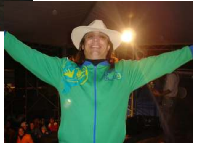
O Show do Tchê Barbaridade um dos pontos altos do Rodeio.

Com Shows muito bons e bailes de respeito o nosso rodeio tirou toda a gauchada prá dançar. Um dos destaques da programação foram as apresentações das invernadas que maravilharam à todas as mãos presentes no nosso rodeio para comemorar o seu dia. Ficou nos olhos de todos o sentimento de saudade do tempo em que Cidreira também tinha uma invernada artística. N o s s o Rodeio cumpriu ao que se propôs. Foi eficiente nos pontos básicos e trouxe um bom público. Agora estamos prontos para realizar um grande rodeio. Todos sabemos que podemos. Então vamos fazer.