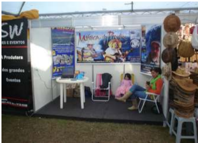
O Stand do Marisco foi bastante visitado.