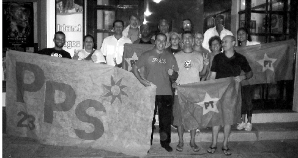
PT e PPS estão juntos na busca pela vitória nas eleições 2008

O PT e o PPS de Cidreira encontraram-se logo após a reunião do PT para, em atitude festiva, firmar a coligação entre os dois partidos. A Reunião foi realizada no Diretório do PT onde a coligação foi aprovada por unanimidade. A parceria entre o PT e PPS vem sendo trabalhada desde a reunião que participaram os dirigentes estaduais, onde já havia a intenção de solidificar a união