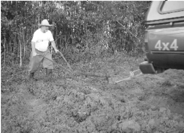
Produtor Rural de Cidreira foi obrigado a usar um arado de mão atrelado a camionete para arar a terra

Para piorar a situação o trator da Patrulha Agrícola, enviado pelo Governo Federal, que deveria estar à disposição dos produtores rurais, passa a maior parte do tempo longe do campo, prestando serviços aqui na cidade. Obrigando os produtores a se virar de qualquer jeito para arar a terra, para que possam plantar.