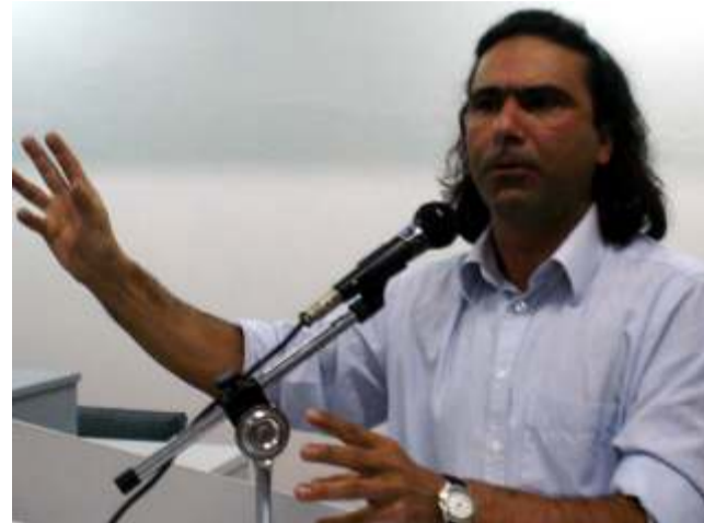
A política de amealhar os supostos "Campeões de Votos" todos para um só lado não convenceu o povo e causou sérios conflitos dentro do PMDB. Tiro no Pé.