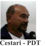
Cestari - PDT