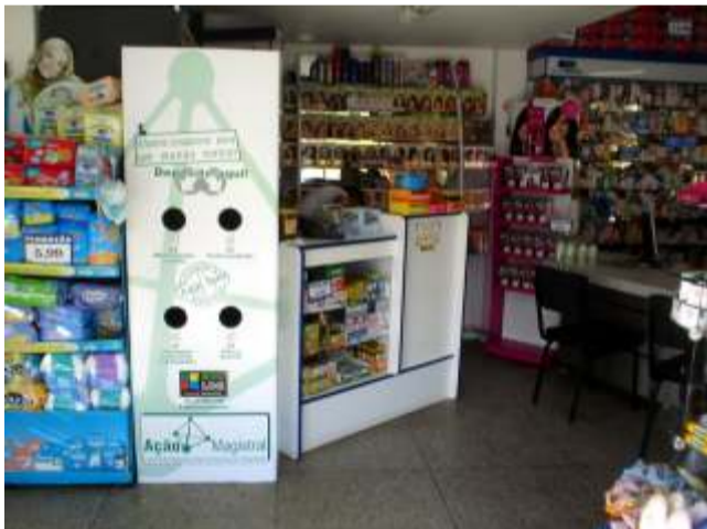
O Coletor está instalado na Farmácia Nova Mistura

Já está à disposição das nossas comunidades na Farmácia Nova Mistura um coletor de resíduos renováveis. Agora materiais como: medicamentos vencidos, cartelas de comprimidos, ampolas, agulhas e seringas, pilhas e baterias não precisam mais ficar acumulados em sua casa ou sendo colocados de forma incorreta no lixo comum. Basta chegar na Farmácia Nova Mistura e depositar na estrutura da Ecolog instalada na loja.