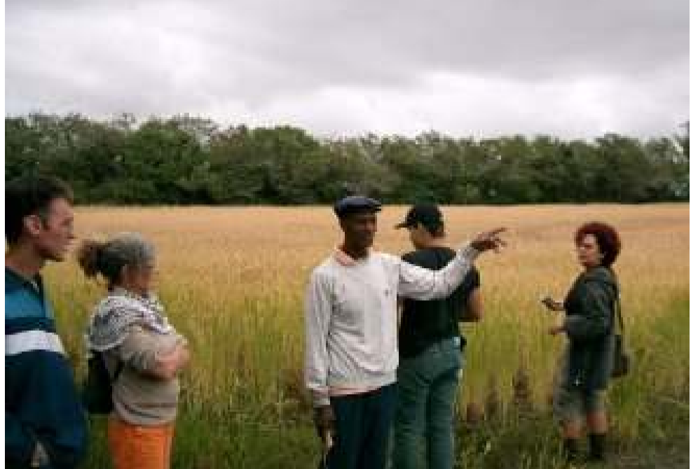
Colheita do Arroz Quilombola em Tavares

Tal, é sucesso garantido, basta verificar o digno e árduo trabalho dos músicos da praia, pesquisadores, compositores e incentivadores, e neste ponto não podemos