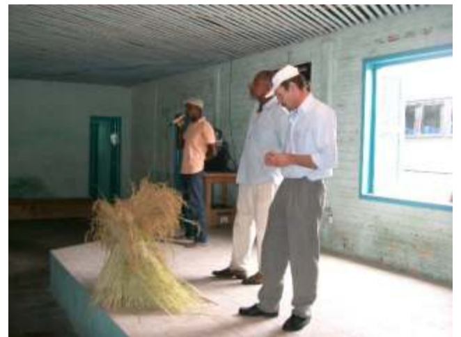
Sede do Projeto do Arroz Quilombola em Tavares

O prato combina com legumes e carne e importante destacar as características de cada um dos ingredientes e principalmente que o arroz quilombola é patrimônio da humanidade e neste ponto, cabe pensar sobre a importância de construir, criar raízes, recuperar elementos da história e cultura da raça.