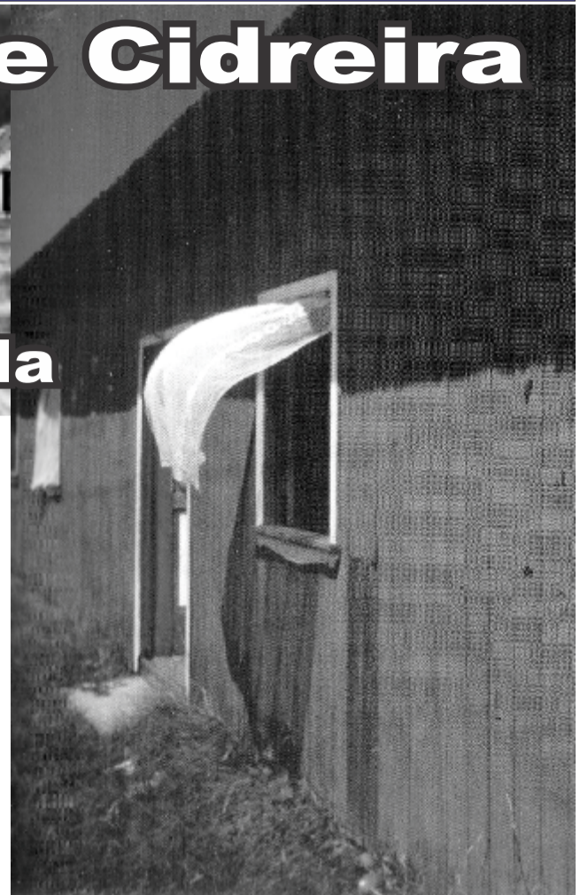
As Janelas das Casas das Vilas da Fumaça e da Viola emolduravam a imensidão de areia que as volteava e os panos brancos nas janelas ao sabor do vento nordestão abanavam como que acenando para saudar os passantes, naqueles tempos de poucas almas.