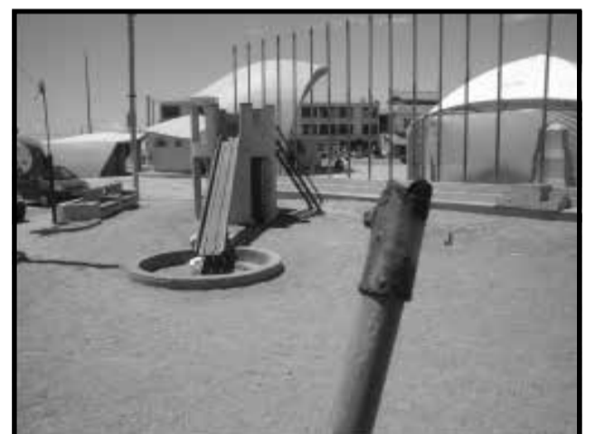
Cano enferrujado oferece risco às crianças

nhuma novidade. Já faz algum tempo que estão quebrados e a Prefeitura não tomou qualquer providência para arrumar, ou pelo menos, retirar do local, diminuindo o risco de alguma crianças se ferir nas ferragens expostas. Todos sabemos que na maioria das administrações públicas as crianças são prioridade. Ao que tudo indica a nossa administração não pensa assim. E continua muito preocupada em apenas fazer camarões.