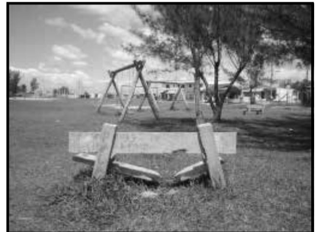
Bancos quebrados nas praças destruídas.

Os bancos quebrados ao largo das praças, não são ne-