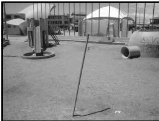
Um pedaço de Cano Enferrujado no meio da praça

A Praça do Largo da Concha é uma das mais frequentadas, e por incrível que possa parecer, é exatamente a que oferece maiores riscos: Canos Enferrujados, Brinquedos sem segurança e Lixo.