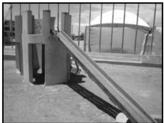
O Escorregador não tem segurança.

O Escorregador da Pracinha na frente da Igreja, tem uma plataforma com mais de dois metro de altura e por