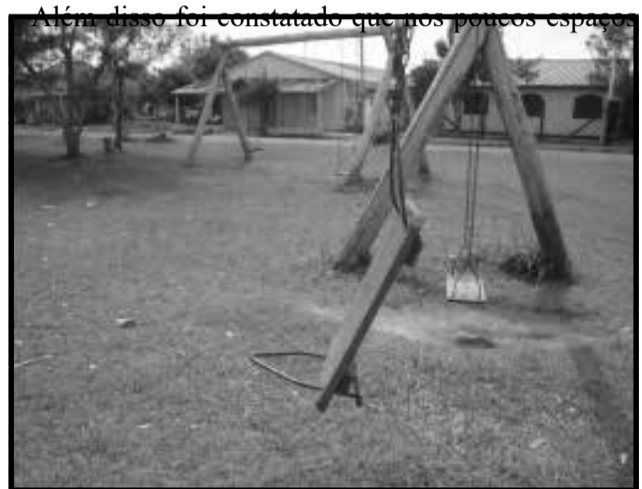
Brinquedos sem qualquer conservação

Os espaços para o lazer infantil em Cidreira, não só são poucos e mal cuidados, como estão em condições deploráveis. São balanços estragados, quebrados, bancos quebrados e pedaços de canos enferrujados que colocam em risco a saúde de nossas crianças.