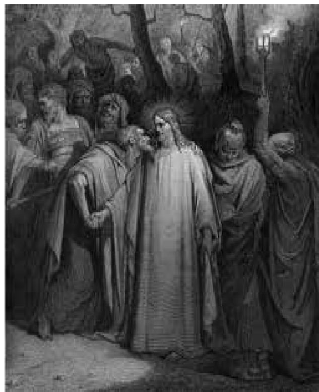
O emblemático beijo com que Judas traiu Jesus.