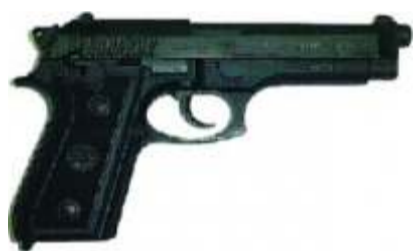
Pistola Ponto 40