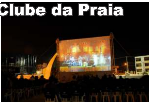
Exibição de Vídeo produzido pelo Diretor Ivan Therra no Largo da Concha

Finalmente o pessoal que gosta de cinema vai ter um espaço para apreciar as melhores produções da oitava maravilha do mundo. O Espaço Crescer está criando o “CINEMAR”, um Cine Clube dedicado à todas as nossas comunidades. O Cinemar está projetando a exibição de filmes periodicamente com Super Tela e Som Especial. A abertura e programação para o mes de março estará sendo divulgada em breve. Para participar basta entrar em contato com o Crescer pelos fones: 3681.1770 e 3681.3456 e fazer a sua inscrição.