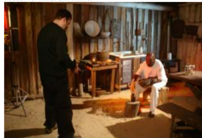
Filmagens do “Maestro da Areia” em Cidreira

O Projeto tem por objetivo fomentar a criação artística na área do Cinema em nossa praia. A Produção de Vídeos capacita às técnicas para a produção de filmes, desde a criação de roteiros, passando pela produção, fotografia, arte, cenário, atuação, edição e finalização. Para se inscrever ligue 3681.1770 e 3681.3456.