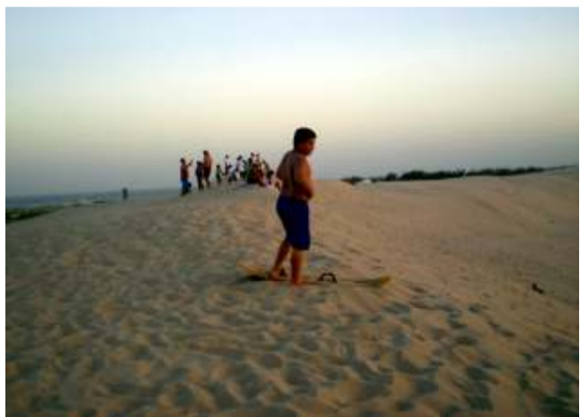
Sand Board nas Dunas da zona A

A galera está cada vez mais ligada no Sand Board praticado nas excelentes dunas de nossa praia. É cada vez maior o número de adeptos deste esporte que vem movimentando muito os espaços naturais de nossa cidade. Nossas Dunas são locais ótimos para a prática do Sand Board e nossas instituições ainda estão devendo uma atenção especial para esta galera que tem vindo para a nossa praia durante o ano todo para a prática do Sand Board. Quem sabe consigamos trazer para Cidreira um evento estadual, nacional ou até mesmo internacional. Vale o sonho!