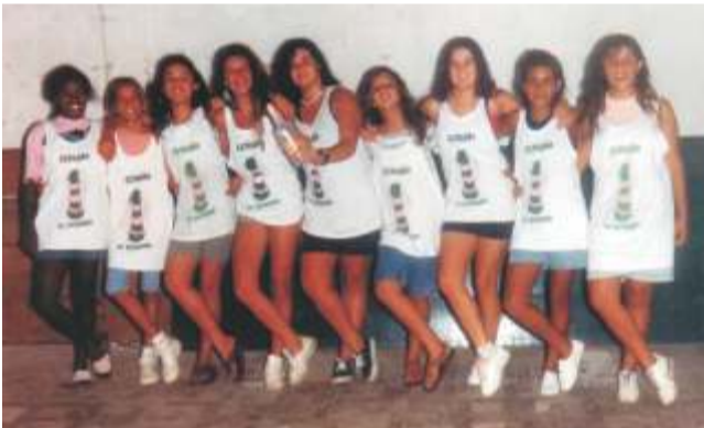
As gurias da Estação Primeira da Cidreira