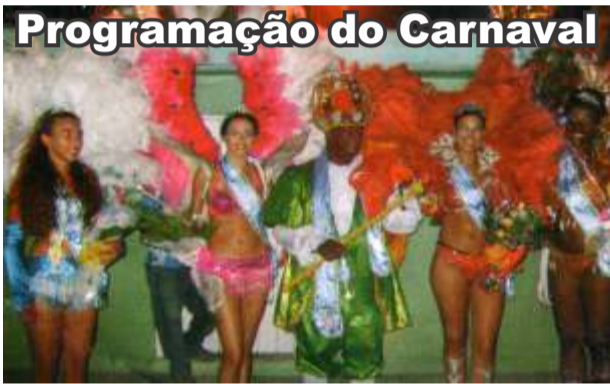
A Corte do Rei Momo em Cidreira

Programação do Carnaval Dias 20, 21 e 24 às 21h Especial Banda Municipal no Calçadão! Todos os Dias! Carnaval na Concha e Av. Mostardeiro com Banda Serra Azul e Vip Brasil! Dia 22 às 21h Desfile dos Blocos! Dia 22 às 21h Dia 23 às 21h Desfile das Campeãs e Premiação!