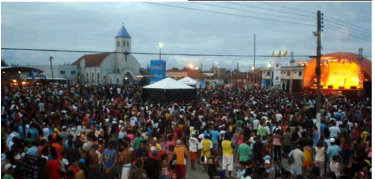
O Carnaval Popular na Concha Acústica de Cidreira

Baile Adulto Sábado/21 *Segunda/23 às 23h Baile Infantil Domingo/22 *Segunda/23 *Terça/24 às 16h Blocos! Concurso de Fantasias! Inscrições na Secretaria ou pelo Cel: 9949.6530 c/ Anselmo A ASAPS está esperando todos os amigos e amigas para curtir o Melhor Carnaval da Praia! Salão Decorado! Banda ao Vivo e Muito Mais! Participe!