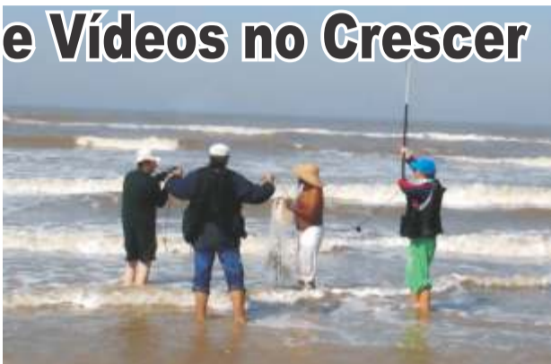
Filmagens do “Maestro da Areia” em Cidreira

O Espaço Cultural Crescer está oferecendo às nossas comunidades Oficinas de Produção de Vídeos. Com os avanços da Tecnologia Digital ficou bem mais barato e acessível fazer um filme.