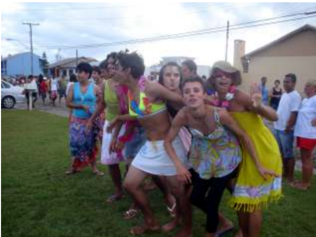
Os gurus fantasiados de gurias em Salinas