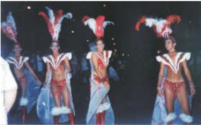
Bloco do Lagoa na avenida