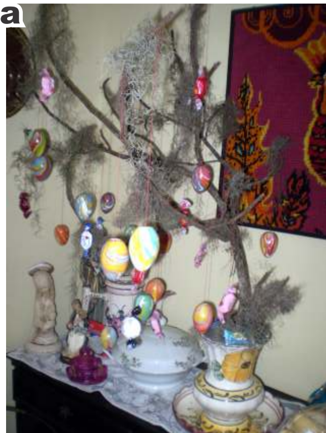
Árvore da Páscoa

No domingo, dia da ressurreição de Cristo, eis que chega o coelhinho, com os ovos de chocolate que desde a tradição romena, ficam escondidos no jardim, formando verdadeiros ninhos coloridos.