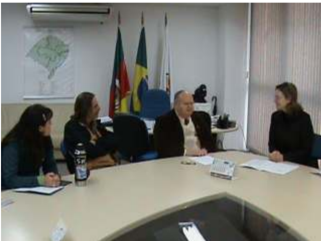
A Deputada Federal Maria do Rosário solicitou que sejam atendidas as reivindicações dos acadêmicos e comunidade de Cidreira.