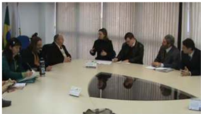
Reunião da Reitoria com a Comunidade e Deputada Maria do Rosário.