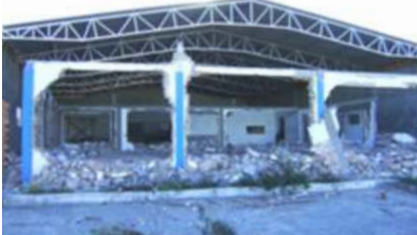
A inauguração está prevista para dezembro