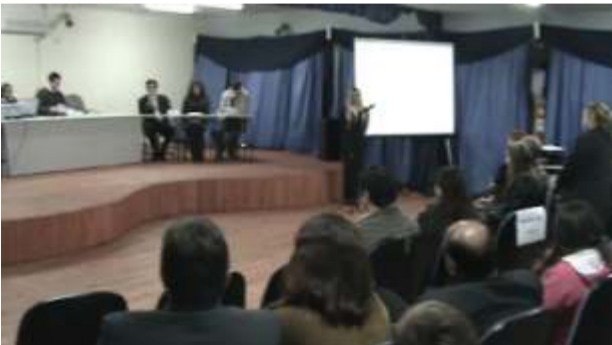
FEPAM ainda recebe comentários sobre o Projeto

A Equipe da HGE apresentou para todos os presentes os seus estudos para que se mantenham preservadas a flora e a fauna da região. No Projeto estão previstas áreas de preservação, com atenção especial aos ninhos de tuco-tucos e também a uma área lindeira à lagoa para a preservação das espécies da flora típica das dunas. Foram observadas inclusive a possibilidade de choque das aves migrantes com os cataventos, para evitar o choque as pontas das pás serão vermelhas. A HGE considerou prioritária a preservação do ambiente.