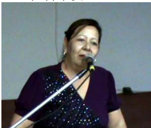
Há mais de tres anos que não temos Diretor de Cultura em Cidreira

A Banda Municipal, único projeto cultural monitorado pela Secretaria, está virado num balaio de gato, sem maestro, sem apoio, indo de qualquer jeito.