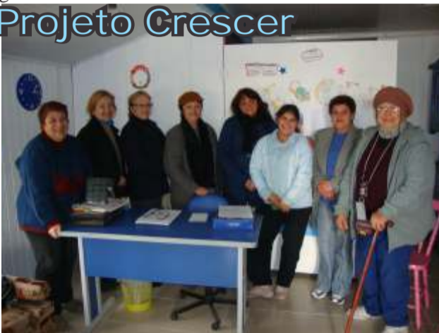
Mulheres de Cidreira no Projeto Crescer.