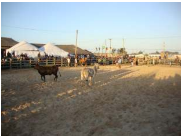
No FuteBoi quem levou a melhor foi a vaca

Com uma programação bem variada e muito bem conduzida pela patronagem do CTG Piaquito do Litoral, a Semana Farroupilha de Cidreira contemplou à todos, com festa campeira e bailes animados.