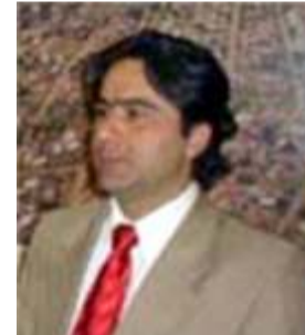
Contas reprovadas em 2008 e 2009