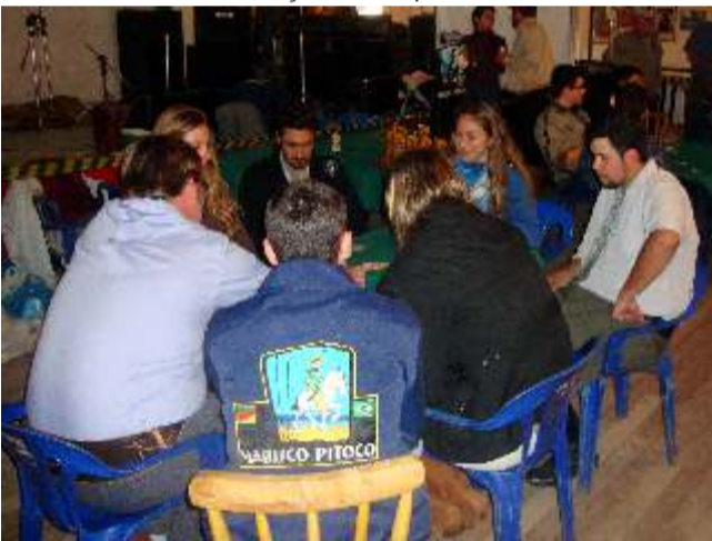
Torneio de Truco Marisco Pitoco... ganharam as gurias.

A Semana Farroupilha dentro do CTG valoriza as instituições e os tradicionalistas da praia, além de ser uma excelente oportunidade para que as nossas comunidades acessem este espaço de cultura e tradição, incentivando a participação da nossa juventude nas atividades propostas pelos CTGs. Vale a Pena!