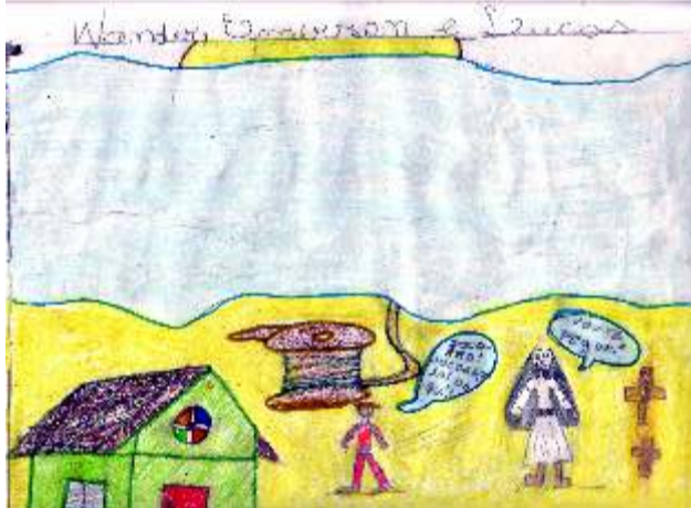
AMC ensina a fabricar brinquedos para a criançada de Cidreira